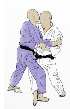
KO UCHI GARI

Technique NE WAZA (Judo au sol) : les techniques devront être démontrées à la suite d'un retournement (au choix, entre-jambe, à 4 pattes, à plat ventre). Si possible, démontrer des sorties d'immobilisations.