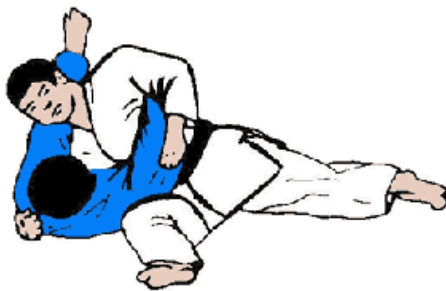
KUZURE GESA GATAME

Technique NE WAZA (Judo au sol) : les techniques devront être démontrées à la suite d'un retournement (au choix, entre-jambe, à 4 pattes, à plat ventre). Si possible, démontrer des sorties d'immobilisations.