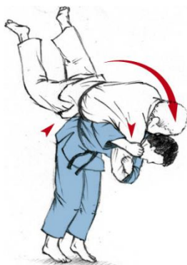
IPPON SEOI NAGE