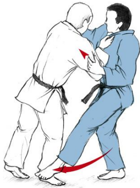
DE ASHI BARAI