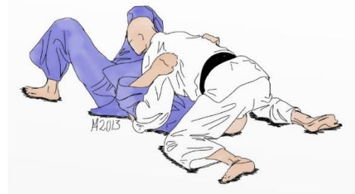
KAMI SHIHO GATAME