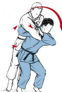
MOROTE SEOI NAGE