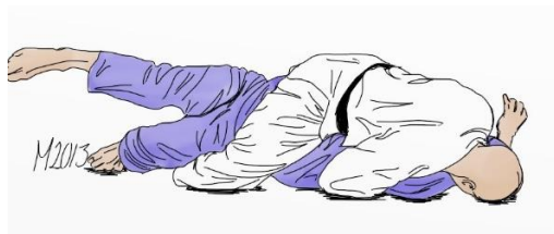
TATE SHIHO GATAME