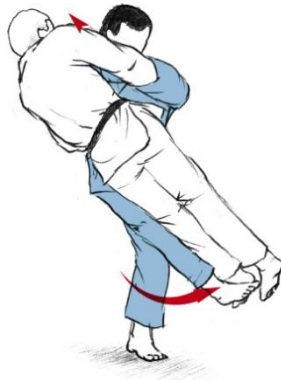
OKURI ASHI BARAI