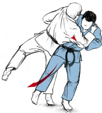
O SOTO GARI

Technique TACHI WAZA (Judo debout) : les techniques devront être démontrées en déplacement et quelques enchainements.