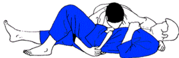
YOKO SHIHO GATAME

A savoir, l'évaluation porte aussi sur la tenue, le comportement durant toute l'année, l'assiduité et éventuelles participations aux compétitions.