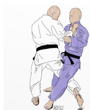
O UCHI GARI