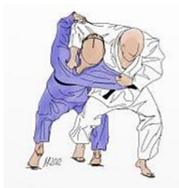
O SOTO OTOSHI